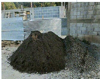
Foto 3: material a utilizar para la fundición de columnas y repello de paredes